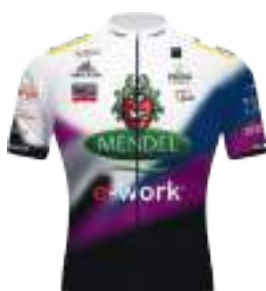
TEAM MENDELSPECK E-WORK