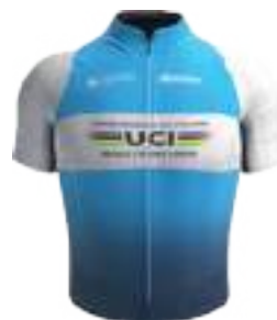
CENTRE MONDIAL DE CYCLISME