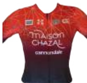
CHAMBERY CYCLISME COMPETITION