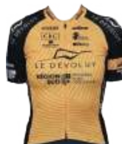
DÉVOLUY RÉGION SUD LADIES CYCLING TEAM