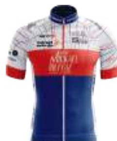
TEAM BUFFAZ GESTION DE PATRIMOINE