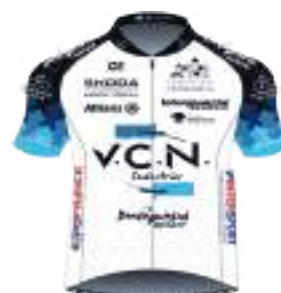
DORDOGNE SUD CYCLISME