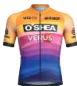
REDCHILLI BIKES O'SHEA