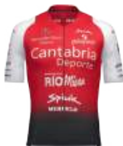
CANTABRIA DEPORTE-RIO MIERA