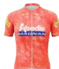
TEAM ABADIE MAGNAN