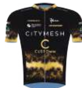
CUSTOMM PRO CYCLING TEAM