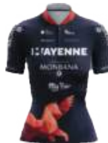
MONBANA MY PIE-WINSPACE ORANGE SEAL