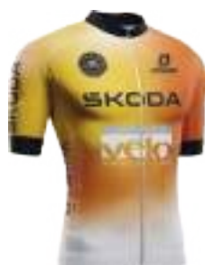
TEAM GRAND SUD CYCLISME FEMININ