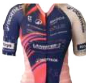
LANESTER WOMEN MORBIHAN