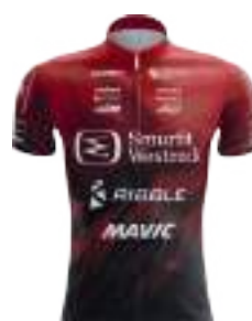
SMURFIT WESTROCK CYCLING TEAM