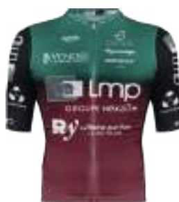
VENDÉE FEMININE RVC