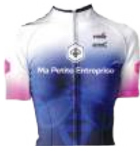
MA PETITE ENTREPRISE