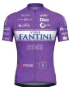
BE PINK-VINI FANTINI