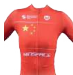
XDS CHINA WOMEN TEAM